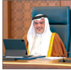
تابع تنفيذ خطة التعافي الاقتصادي.. مجلس الوزراء: