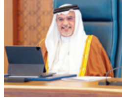
© سمو ولي العهد رئيس مجلس الوزراء يترأس جلسة مجلس الوزراء.

رأس صاحب السمو الملكي الأمير سلمان بن حمد آل خليفة ولي العهد رئيس مجلس الوزراء الاجتماع الاقتصادي الأسبوعي لمجلس الوزراء الذي عقد أمس بقصر القديسية. خلال الاجتماع تابع المجلس ما تم على صعيد تنفيذ خطة التعافي الاقتصادي، التي تركز على ٥ أولويات تضم ٢٧ برنامجاً متكاملًا، وذلك في ضوء استمرار الشراكة المرفوعة بينه وبين الحكومة من اللجنة الوزارية للشؤون المالية والاقتصادية والشؤون المالي والتي أظهرت أنه تم الانتهاء من ١٦ برنامجاً من أصل ٢٧ تضمنته الخطة، وأن العمل جارٍ على الانتهاء من تنفيذ ١١ برنامجاً خلال الفترة القادمة، كما أظهرت أن المؤشرات الاقتصادية سجلت ارتفاعاً إيجابياً في العديد من القطاعات والتي تعكسها نتائج العمل في المصارف المختلفة التي تم تنفيذها، حيث أشاد المجلس بالجهود التي تم بذلها على هذا الصعيد بروح الفريق الواحد من قبل الجميع وأكد أهمية مواصلة العمل بتكاتف الجميع من أجل الوصول للنتائج المرجوة من الخطة، مشيراً بالاعتماد المتبادل بين السلطين التنفيذية والتشريعية وديمور القطاع الخاص في تنفيذ أولويات خطة التعافي الاقتصادي وبرامجها.